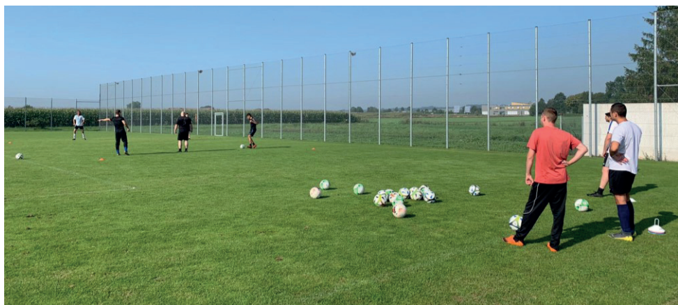
Spieler in Aktion: Zum Aufwärmen bei verschiedenen Passübungen