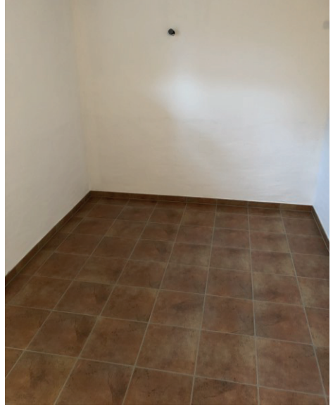
Alter Heizungsraum während und nach Renovierungsarbeiten