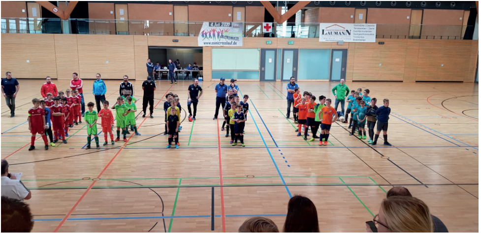
Eskara Hallensaisonfinale 2020 (E-Jugend)

Neben dem Trainings- und Spielbetrieb in der Freiluftzeit sind wir in der Winterzeit zwischen Mitte November und Mitte März im Hallenfußball aktiv. Hier finden regelmäßige Trainingseinheiten in der Eskara und der Zweifachturnhalle statt. Wir nehmen an den Hallenkreismeisterschaften teil und folgen vielzähligen Einladungen zu Hallenturnieren von befreundeten Vereinen. Ein besonderes Highlight ist jedes Jahr unser selbst ausgerichtetes Turnier in der Eskara, zu dem ein ganzes Wochenende lang viele Mannschaften aus der Umgebung anreisen und toller Hallenfußball in allen Altersklassen vor begeisterten Zuschauern geboten wird.