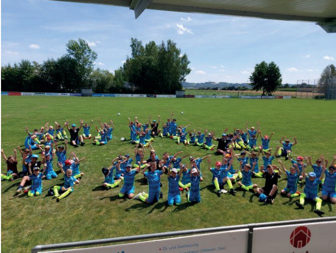
Kinder in voller Aktion bei der Hans-Dorfner Fußballschule

Zur Förderung der Nachwuchskicker und als schönes Ferienevent findet seit Jahren bei uns zum Beginn der Sommerferien ein 4-tägiges Fußballcamp mit rund 80 Kindern statt. Hier haben wir mit der Hans-Dorfner-Fußballschule einen attraktiven Partner, der den Kindern hochwertige Action und Spaß vermittelt und unsere Jugendarbeit als Partnerverein sehr gut unterstützt. Der Termin für 2021 ist bereits fest ausgemacht. Das Camp findet vom 09. bis zum 12. August 2021 wieder beim SVE statt.