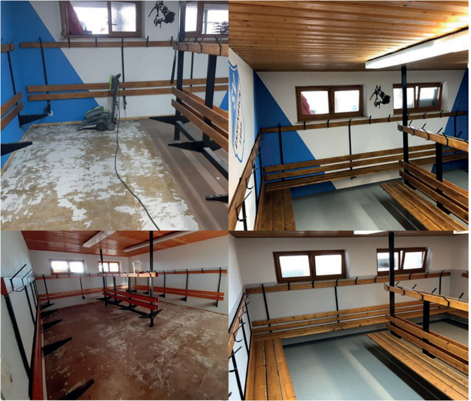
Kabine während der Arbeitsphase und nach Fertigstellung