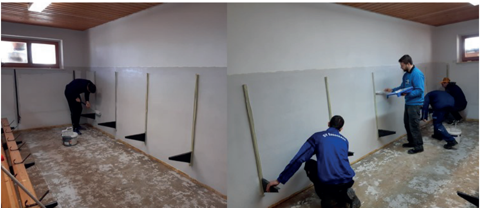
Fleißige Helfer bei der Arbeit

Der alte Boden hatte seinen Dienst seit Errichtung des Sportheims nun 30 Jahre sehr gut erfüllt. Eine Erneuerung war nun aus ästhetischen sowie funktionellen Gesichtspunkten erforderlich. Aufgrund der bestätigten langen Haltbarkeit und guten Widerstandsfähigkeit entschied man sich wieder für einen Kautschukboden, der mit einem hellen, grauen Muster die Kabinen nun aufwertet.