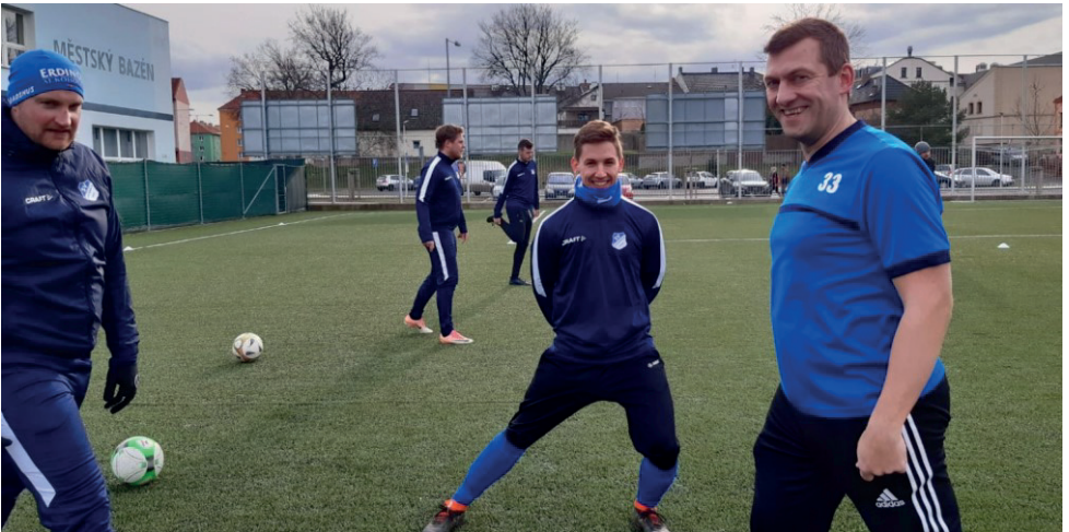
Spieler in Aktion: Im Vordergrund beim Dehnen und im Hintergrund bei einer Passübung