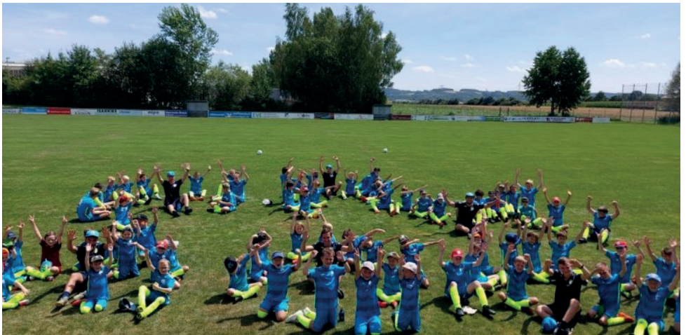
Mit Spaß und Freude am Werk: Auch Teambuilding wurde „groß“ geschrieben.