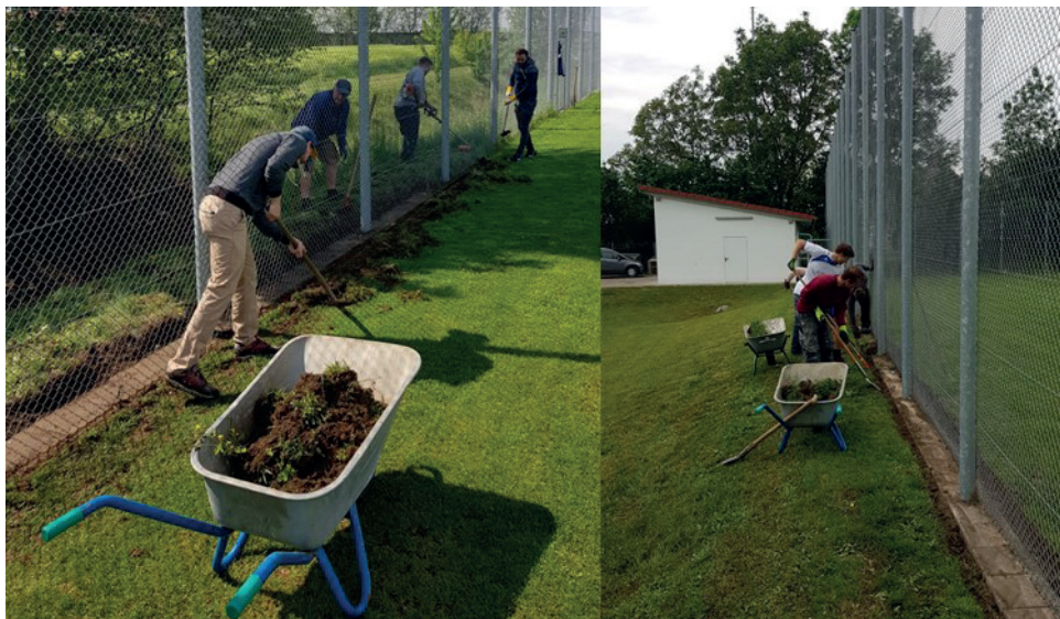
Spieler, Trainer und Fans bei den Instandhaltungsarbeiten am Fangzaun