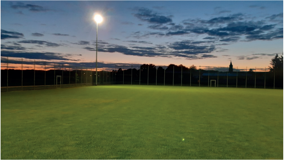
Trainingsplatz mit neuer LED Flutlichtanlage

Naturschutz und nukleare Sicherheit aufgrund eines Beschlusses des Deutschen Bundestages gefördert.