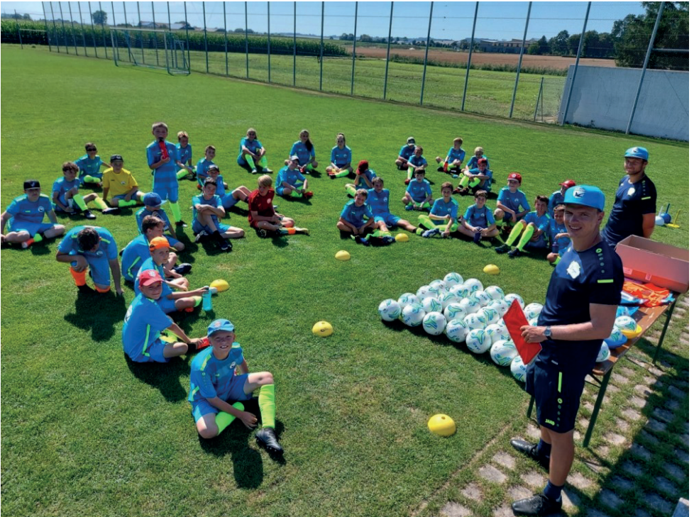
Trainer der Hans Dorfner Fußballschule bei der Siegerehrung der Jugendkicker