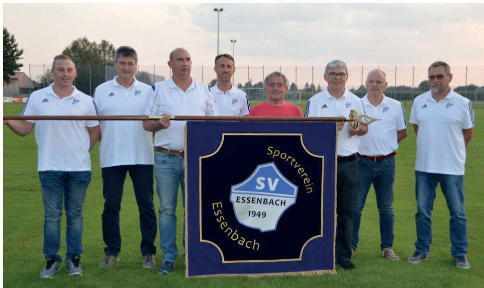
Fahrenträger mit der neu geweihten SV Essenbach Fahne